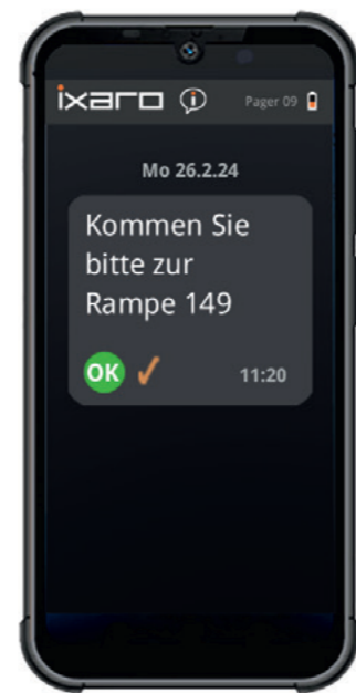
IXARO-ePager in der Basisfunktion mit Nachrichtempfang und Quittierfunktion